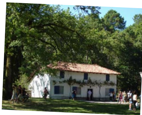
Le quartier landais

Ça et là autour du petit patrimoine bâti et dans les maisons, des mises en scène sonores vous révèlent de manière artistique et poétique les mythes et les croyances locales autour d'événements importants de la vie d'autrefois. Des animations et fêtes régulières pendant la saison vous permettent de participer aux travaux d'époque (confection des croix de la St Jean, cuisine landaise, etc.), de renouer avec les traditions et pour certains de retrouver non sans émotion les gestes d'autrefois.