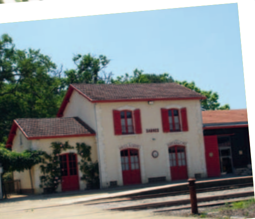
La gare de Sabres