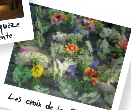
Les croix de la St Jean