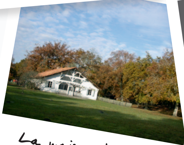
La maison de Maître