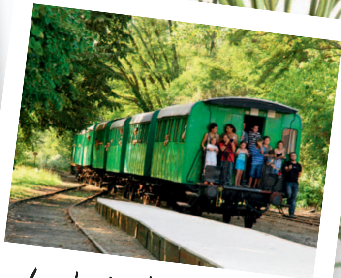
Le train de Marquèze