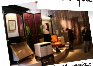
Le Pavillon de Marquèze Exposition permanente